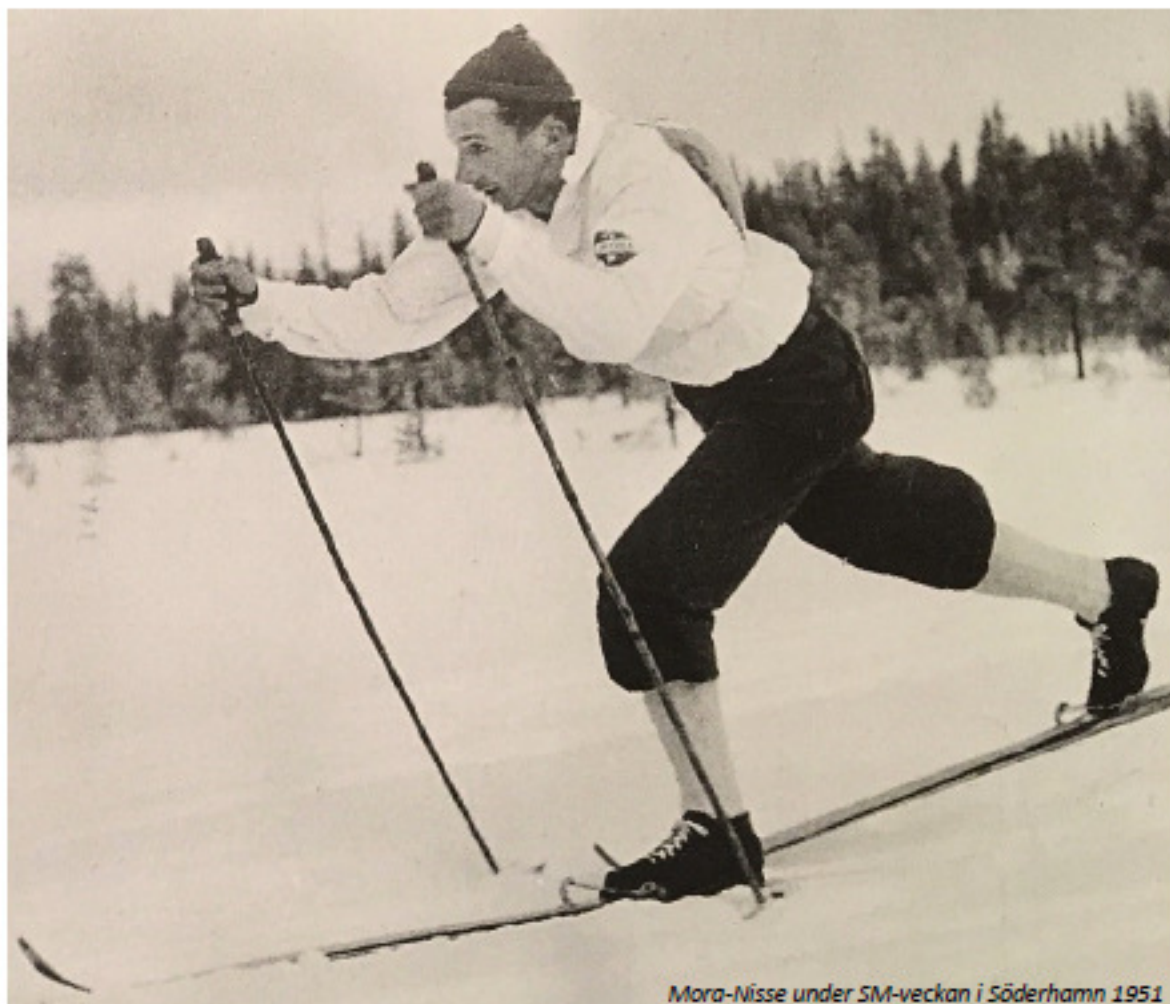
Mora-Nisse under SM-veckan i Söderhamn 1951

Välkomna till en utställning om Söderhamns skidhistoria! Här möter du legenderna, får höra historierna och se föremål som du kanske glömt eller inte visste fanns!