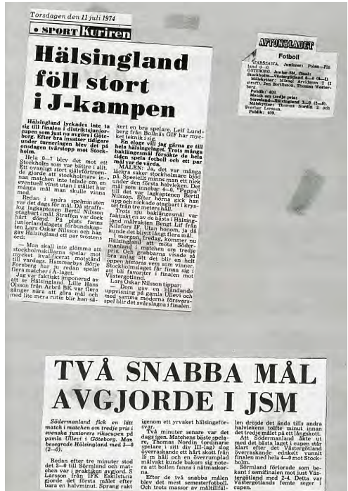
Några tidningsurklipp från Hälsinglands matcher.

I matchen om tredje pris mot Södermanland hamnade Hälsingland snabbt i ett tvåmålsunderläge och till slut blev det förlust med 3–0. Resultatmässigt långt ifrån vad de unga hälsingegrabbarna tänkt sig, men ingen kan ta ifrån dem att de faktiskt spelat ett slutspel på Gamla Ullevi.