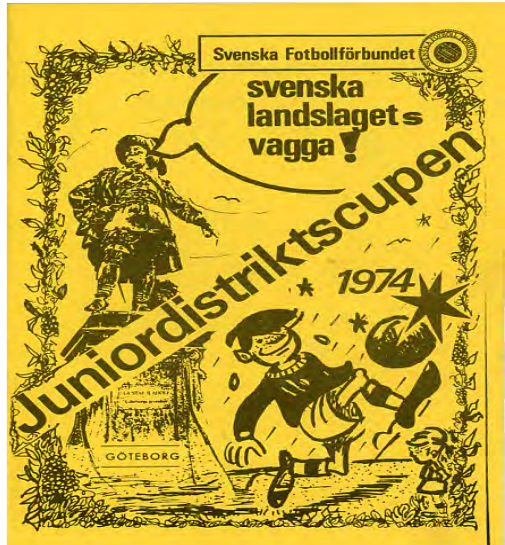
Programbladet från slutspelet i Juniordistriktscupen 1974.