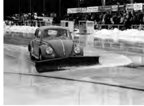
...och med hjälp av en ombyggda bubbla lyckades man få till en spelbar plan...