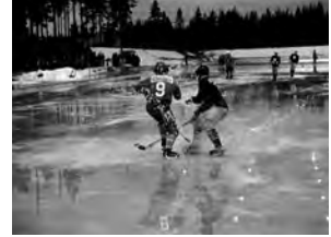
men vattnet yrde i matchen mellan Bollnäs och Sandviken 30 december 1973