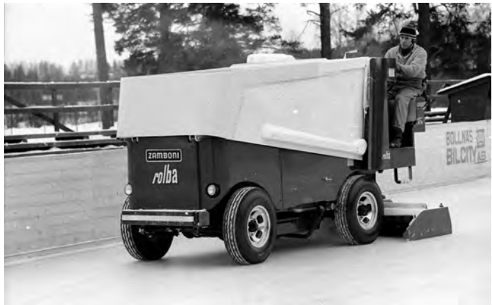
Bollnäs får som första ismaskin i november 1973.

Bandy flyttade till Sävstaås 1973 men fortfarande var man utan konstfryst.