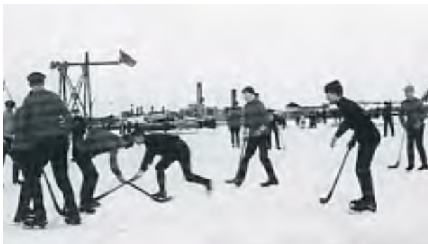
Här spelas det bandy på Söderhamnsåns is någon gång runt 1920-talet. Söderhamns IF har faktiskt sju DM-tecken i den sporten.