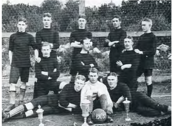
En lagbild från 1905, möjligen efter segern i det första DM:et i fotboll där man finalbesegrade Iggesund.