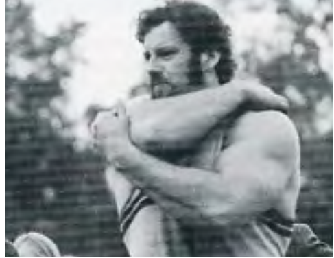
Ricky Bruch (till höger) var ett av många världsnamn som tävlade i Söderhamn.

Under många år arrangerade Söderhamns IF stora friidrottsgalor med svenska stjärnor som Hans Lagerkvist, Kjell Isaksson, Ove Berg, Anders Gärderud, Ulf Högberg, Christer Garpenborg och kanske framför allt Ricky Bruch i startfältet. Även amerikanske diskuskastaren Jay Silvester har tävlat i Söderhamn. Silvester tog för övrigt OS-silver i München 1972 där Ricky Brush blev bronsmedaljör. Al Fuebach, Randy Williams, Don Quarrie, Pekka Wasala, Ron Clark, Dwight Stones.., ja, listan på världsstjärnor i Söderhamn är hur lång som helst.