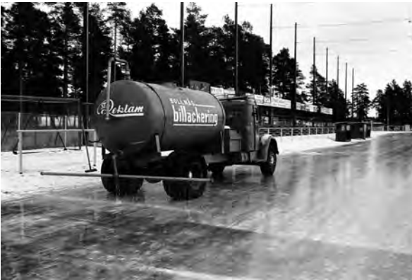
Ismaskin av äldre modell på Sävstaås. Första spelbara isen kom i november 1975.