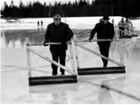
Funktionärer förstärkta med iskrapor försöker få bort vatten från planen...