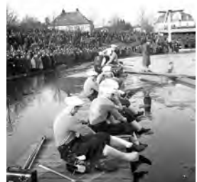
Finska landslagsspelare byter till skridskor vid Tinnerbäcksbadet i Linköping 1949.

Ända sedan bandyn startade i Bollnäs 1906 har bristen på is varit ett av de svåraste problemen att övervinna och olika händelser har på något sätt styrt utvecklingen framåt. Vid en landskamp mellan Sverige och Finland på Tinnerbäcksbadet i Linköping 1949 gick domaren genom isen efter tre minuter och bröt då matchen.