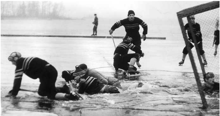
Isen på Storsjön brast efter sju minuter när Forsbacka mötte Köping 1960.

Detta gjorde att SM-finalen mellan Nässjö och Edsbyn samma år blev slutet för SM-finaler och landskamper på sjöisar. Matchen på Storsjön mellan Forsbacka och Köping i division 1 norra 3 januari