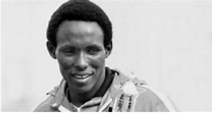
Efter ett politiskt spel på högsta nivå kom Filbert Bayi (bilden ovan) till slut till Söderhamn.